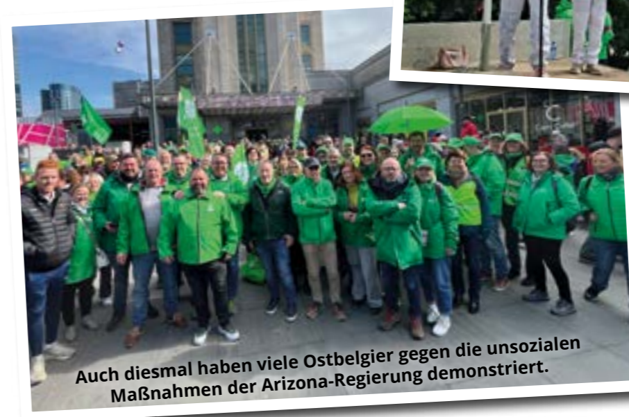
Auch diesmal haben viele Ostbelgier gegen die unsozialen Maßnahmen der Arizona-Regierung demonstriert.