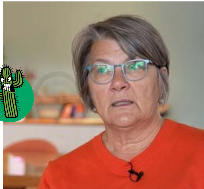
Solange (59) verbindet ihre Arbeit mit der Betreuung ihrer beiden behinderten erwachsenen Kinder.